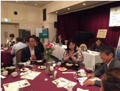
大阪ネクストRC呉会長・中川幹事