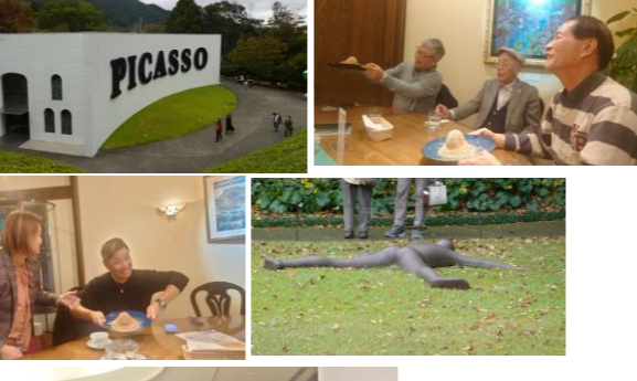
小田原中RCとの交流会