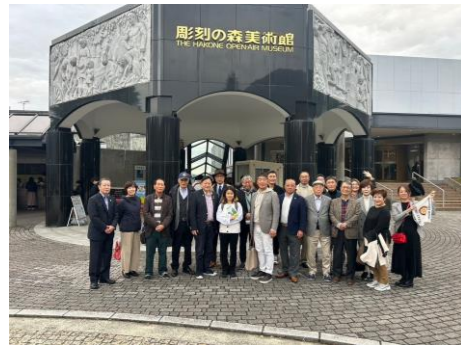
箱根彫刻の森美術館