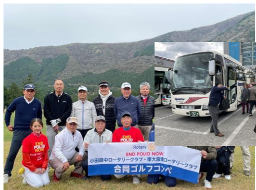
小田原中RCとのチャリティゴルフ