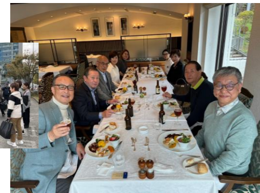
山のホテルヴェルボアでフレンチランチ