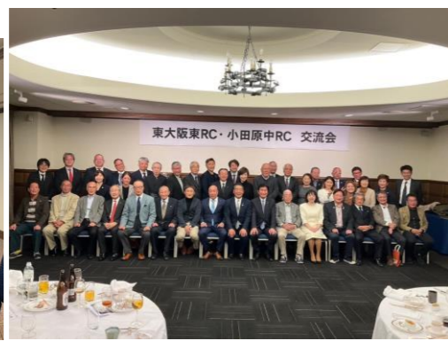
小田原中RCとの意見交換会 2日目