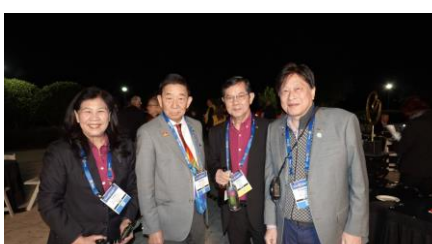
3350地区タイのガバナーエレクト