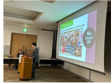
～ローターアクト部門～